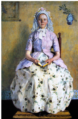
Gary Melchers, The Communicant

Pas eind 19e eeuw sloeg de industriële revolutie in Nederland aan, veel later dan in omliggende landen. Juist vanwege dit uitblijven van industrialisering werd Nederland populair bij reizigers en schilders, met name de dorpen en stadjes in Holland, aan de Zuiderzee, in het Gooi en aan de kust. Vooral Amerikanen overspoelden de vissersdorpen, van Volendam tot Veere. Zij vonden hun religieuze oorsprong terug in Holland, in strenggelovige gemeenschappen omringd door tulpenvelden.